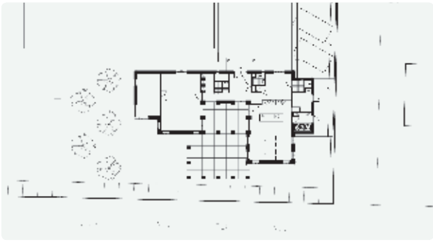
Plattegrond begane grond en situatie