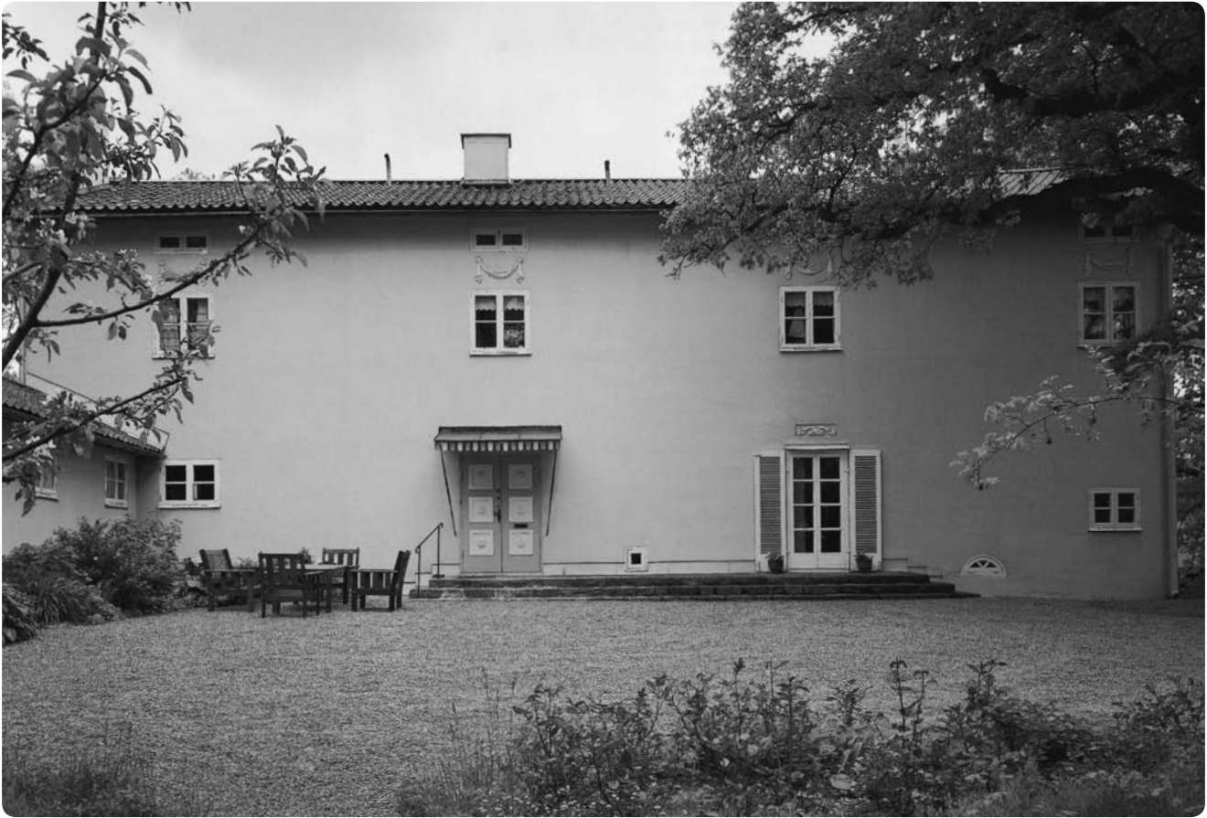
Referentiebeeld Villa Snellman, Djørsholm / architect Gunnar Asplund